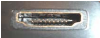
HDMI Single Link-Type A-Male