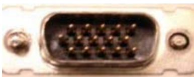
HD-15 Conector Analógico Male